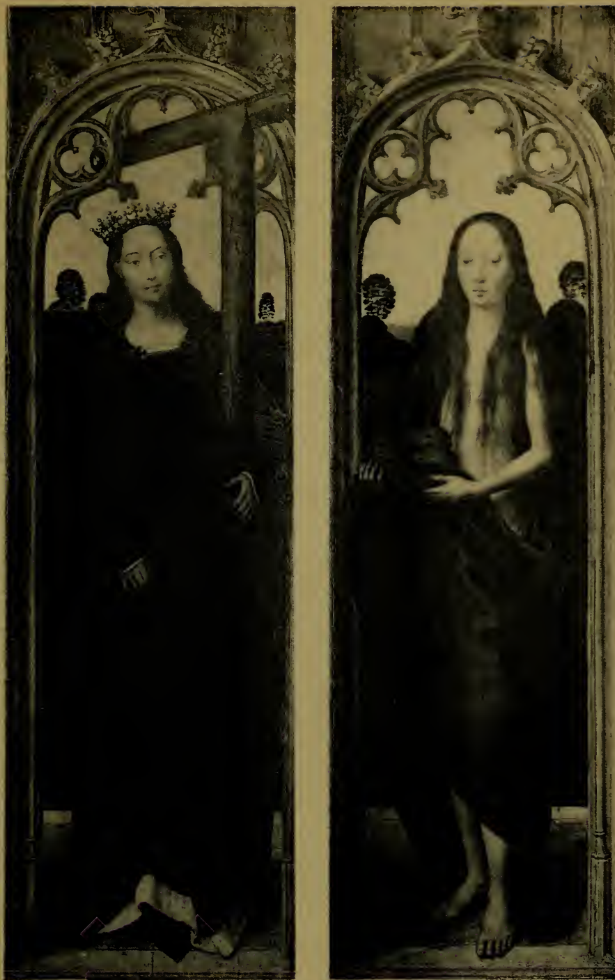
Sainte Wilgeforte & Sainte Marie l'Egyptienne.